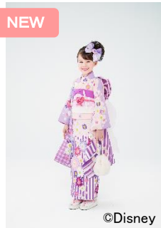
<デイジーダック(7歳女児 四つ身)>

ドナルドダックのカラーを使用した羽織に、足跡、帽子、浮き輪が青海波柄の中に見え隠れするデザインとなっております。背中から右肩にはドナルドの足跡があり、海を満喫しているドナルドが連想されるような楽しい1枚です。