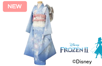
<エルサ(7歳女児 四つ身)>

七五三着物として初登場の袴と、軽やかなオーガンジーの羽織は快活なアナのイメージにぴったりです。袴には生地の重なる部分に紫色が隠れており、歩くたびに紫が見え隠れしお洒落なデザインとなっております。バッグは斜めがけもできる2way仕様です。