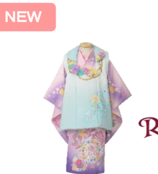
<ラプンツェル(3歳女児 被布)>