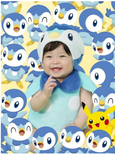
「ポッチャマ大集合」

ポッチャマが大集合した目を引くデザイン。色もシルエットも可愛いポッチャマとの撮影を楽しめます。