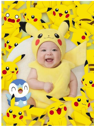
「ピカチュウ大集合」

ポッチャマが大集合した目を引くデザイン。色もシルエットも可愛いポッチャマとの撮影を楽しめます。