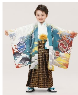
レックウザ (5歳男児 110cm 羽織)