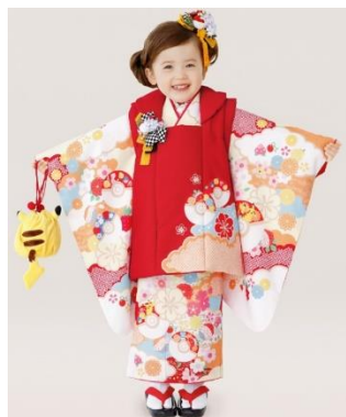
ピカチュウ (3歳女児 100cm 被布) >

「ピカチュウ」「イーブイ」「リザードン」の撮影専用着物は、8月1日(日)より撮影開始いたします。「レックウザ」を含めた七五三おでかけ用着物レンタル衣装は9月11日(土)からのレンタル開始に向けご予約受付中です。