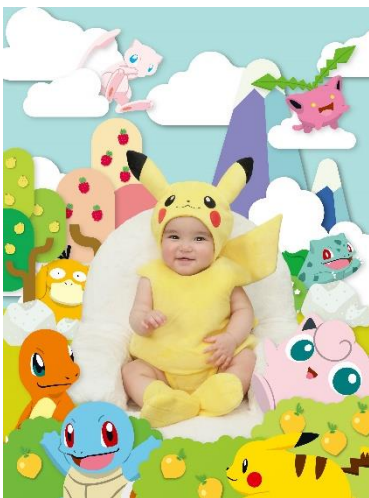
「ポケモンかくれんぼ」

ポケモンの住む世界で、お子さまとポケモンたちがかくれんぼをしているような楽しいデザインです。