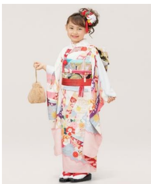
イーブイ (7歳女児 120-130cm 四つ身)