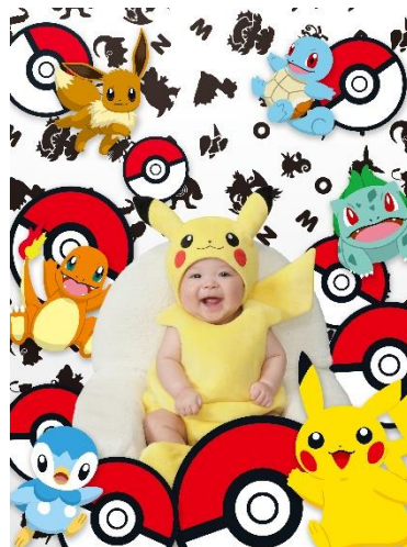
「モンスターボール」

ポケモンの住む世界で、お子さまとポケモンたちがかくれんぼをしているような楽しいデザインです。