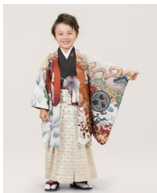
リザードン (5歳男児 110cm 羽織)