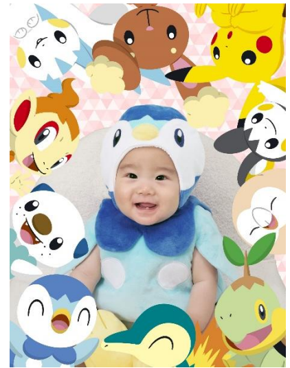
「サイコーエブリワン」

ピカチュウが大集合した目を引くデザイン。ピカチュウになりきっての撮影を楽しめます。