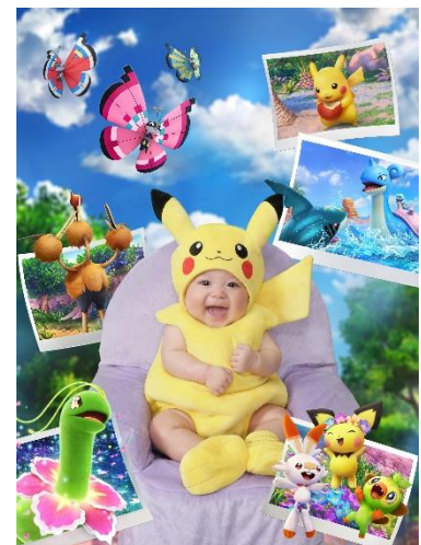
「New ポケモンスナップ」