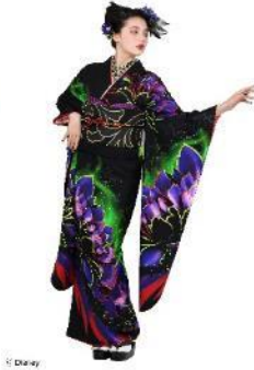
8位:マレフィセント