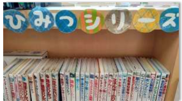
全国の小学校図書室ですでにコーナー化している「ひみつシリーズ」