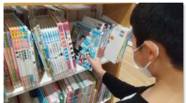
寄贈した「記念写真のひみつ」を読んでいる子どもたちの様子